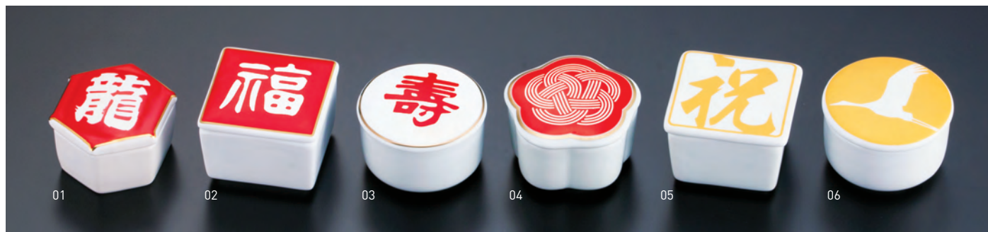
陶器・龍鳳亀甲珍味入

19-250-01 (26600) 350円 約5×6×H3.3cm ※輸入陶器 (小箱10ヶ入)