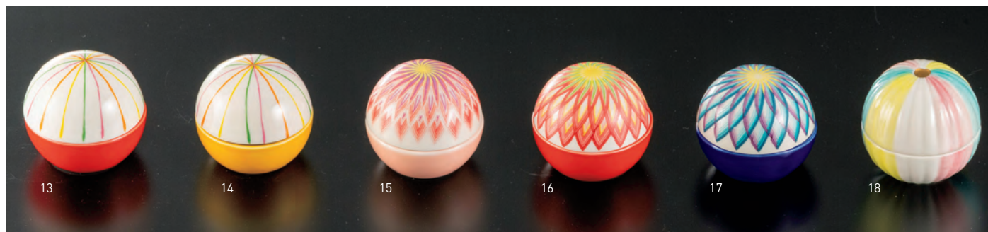
手まり型珍味入 (赤)

19-250-12 (26996) 450円 約10×5.5×H3.8cm ※輸入陶器 (小箱10ヶ入) ※内側・赤