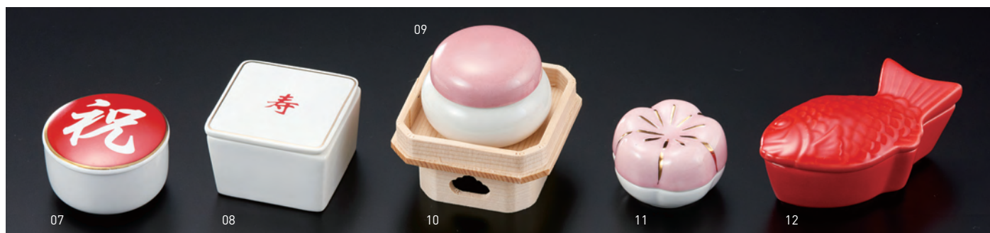
蓋付丸珍味入・祝

19-250-06 (26779) 290円 約φ5.7×H3.5cm ※輸入陶器 (小箱10ヶ入)